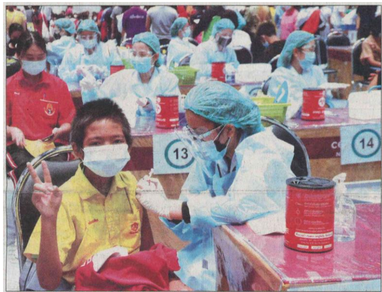
▲ ฉีดวัคซีน : นักเรียนหลายโรงเรียนในพื้นที่ จ.นครราชสีมา เข้ารับการฉีดวัคซีนไฟเซอร์ เพื่อป้องกันการติดเชื้อไวรัสโควิด-19 ที่จุดบริการฉีดวัคซีนนอกโรงพยาบาล โรงพยาบาลมหาราชนครราชสีมา ที่ศูนย์การค้าเซ็นทรัลพลาซา โคราช หลังมีการเปิดภาคเรียนที่ 2 ปีการศึกษา 2564 แบบ (Onsite)

ข่าวประจำวันพุธที่ ๑๗ พฤศจิกายน ๒๕๖๔ หน้าที่ ๑